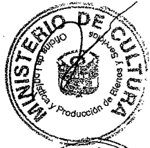
JUAN OSSIO ACUÑA Ministro de Cultura