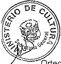
DIANA ALVAREZ-CALDERÓN Ministra de Cultura