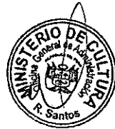
DIANA ALVAREZ-CALDERÓN Ministra de Cultura