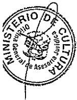
DIANA ALVAREZ-CALDERÓN Ministra de Cultura