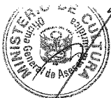
PATRICIA BALBUENA PALACIOS MINISTRA DE CULTURA