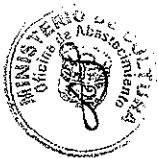
CARLOS FELIPE VALOMARES VILLANUEVA Director General de Administración Ministerio de Cultura