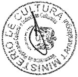
..... SALVADOR DEL SOLAR LABARTHE Ministro de Cultura